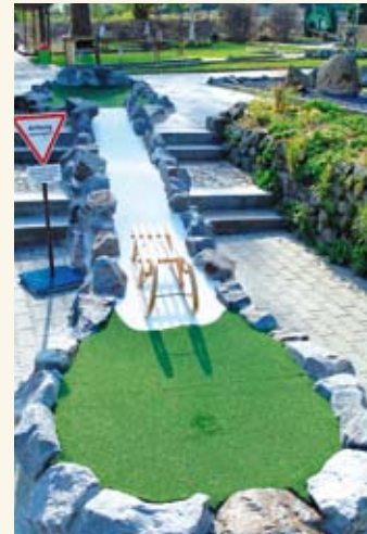
Der Tecklenburger Rodelberg