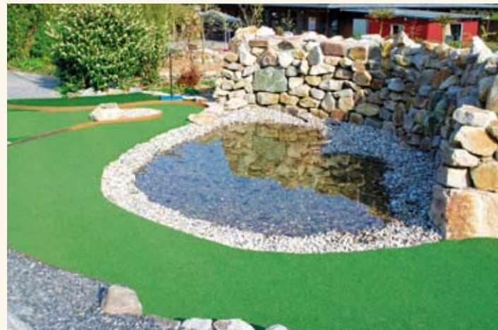
Der Lengericher Canyon