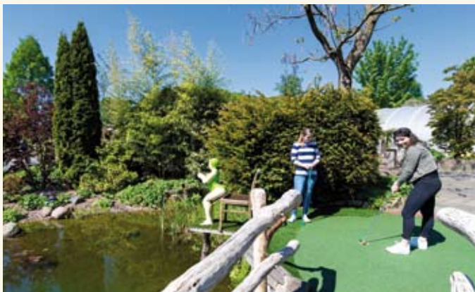
Am Tecklenburger Königssee

Bis zu 15% Rabatt bei Online-Buchung! Weitere Infos unter: www.abenteurgolf-tecklenburg.de