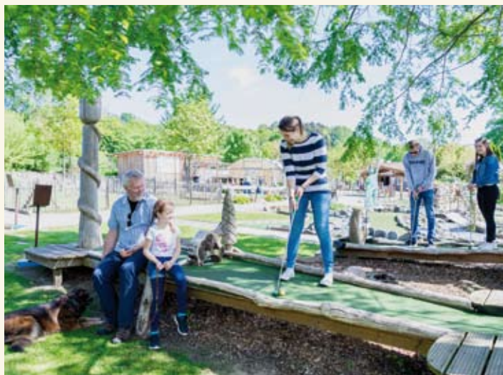
Das höchste der Gefühle: der Kletterwaldparcours