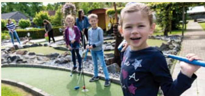
Hinein ins Vergnügen für Jung und Alt