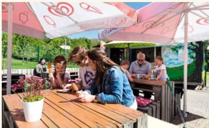
Nach erfolgreicher Runde gibt es die verdiente Stärkung